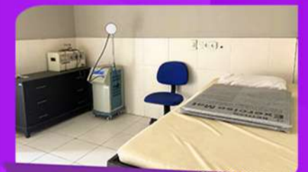
Ruang Praktikum Fisioterapi