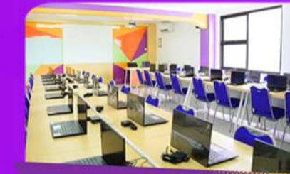
Lab. Cyber Law