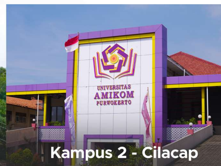
Kampus 2 - Cilacap