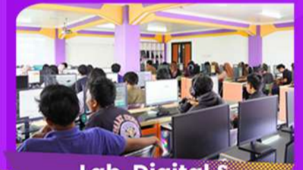
Lab. Digital & Social Media