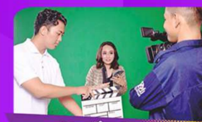
Studio Green Screen