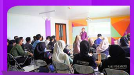
Ruang Kelas Modern