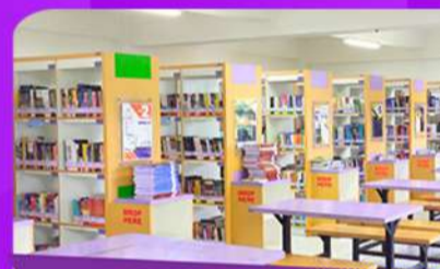
Perpustakaan Masa depan