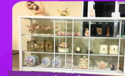
Perlengkapan Praktik Kebidanan