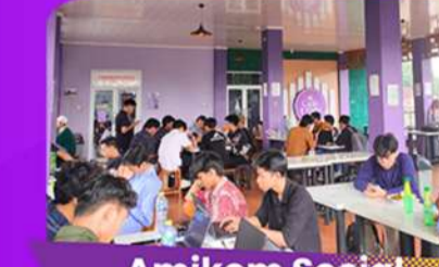
Amikom Social Space