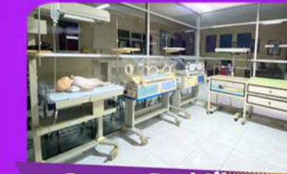
Ruang Praktikum Kebidanan